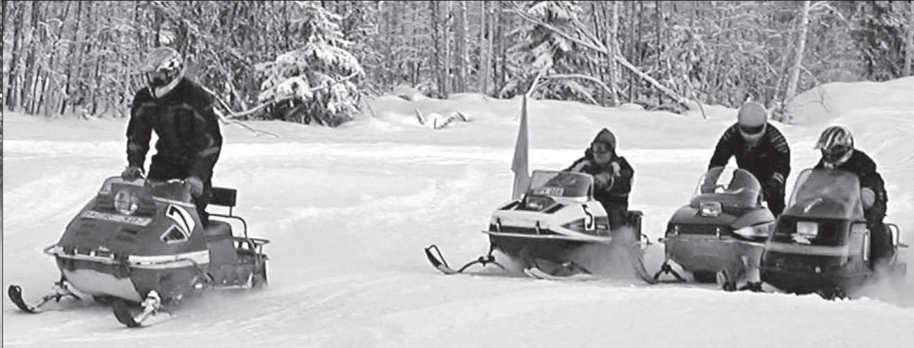
Starten har gått och de tävlande drar på.

TEXT MÅNICA BRÄNNSTRÖM