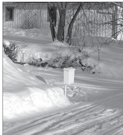
En möjlig "utpost" för en nödig hund.