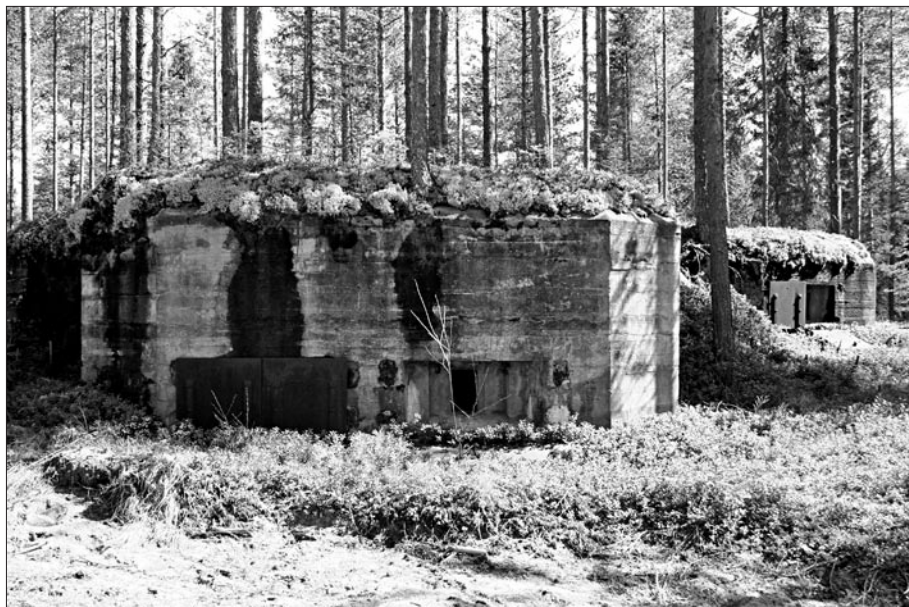
Bunker både från ut- och insidan.