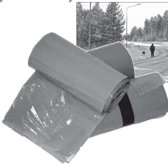
Dam med hund.

Så hundägare, skärp er när ni går med hundarna i villakvarteren. Rasta gärna hundarna i skogen, där är hundbajs inte är något onaturligt. Annars vill vi nog att ni använder påsar.