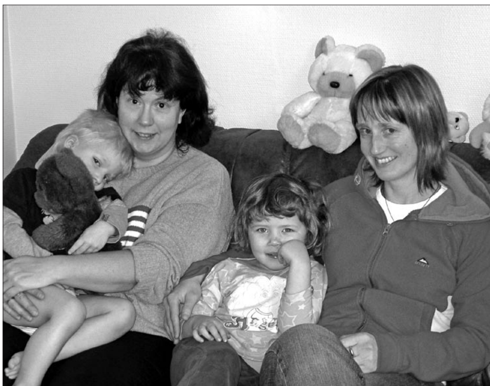
Piraterna i soffan.

DEN 1 FEBRUARI detta året firade Piraten 1 år. De visade upp en utställning på skolan med foton och barnens olika alster. Chokladbollar och saft fanns med på menyn och föräldrarna bjöds in till öppet hus dagen till ära.